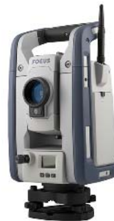
Spectra Geospatial Focus 50